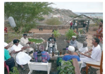
■ Grupo de músicos y cantantes durante el rodaje.