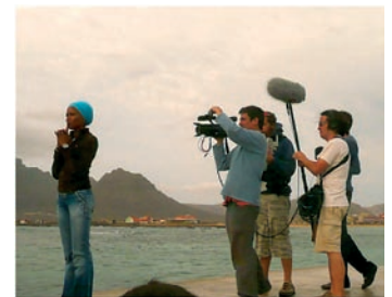
■ Protagonista del documental y equipo técnico.