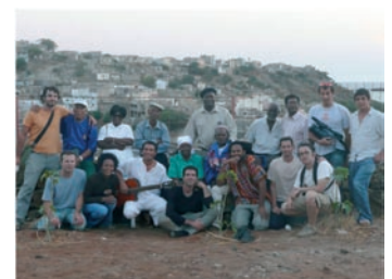
■ Integrantes del proyecto.