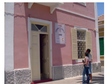
■ Casa de Acogida Crisanto Lopes de Mindelo.