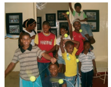
■ Niños de la Casa Crisanto Lopes.