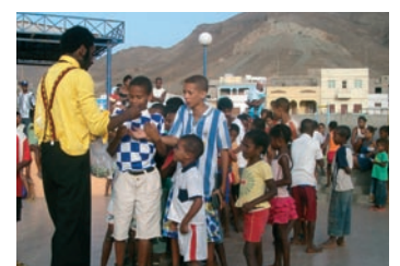
■ Programa de juegos de pre-deporte.