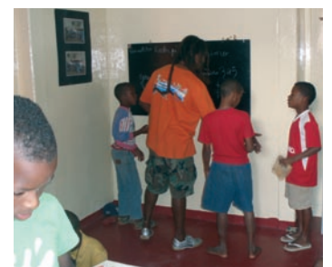
■ Trabajo como educador en la Casa Crisanto Lopes.