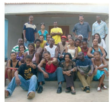
■ Grupo de formación en radio comunitaria.