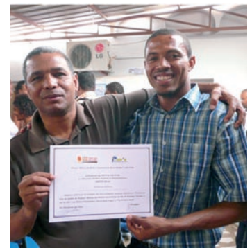
■ Alumno del curso de Gestión de Radio Comunitaria.