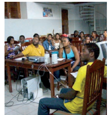
■ Curso de formación en radio comunitaria.