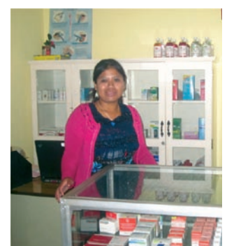
■ Empleada del botiquín de medicamentos básicos.