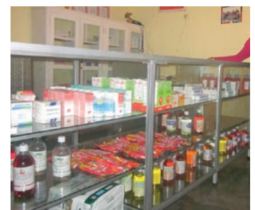
■ Botiquín de medicamentos básicos