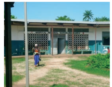
■ Vista frontal del Hospital