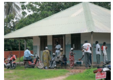
■ Vista del Hospital Marcelino Banca