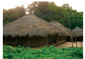
■ Comunidad de Ancamona