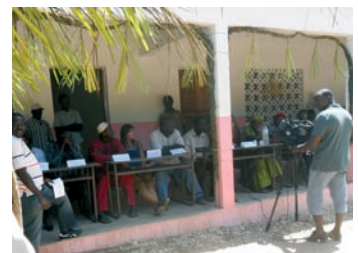
■ Acto de entrega de la escuela a la dirección administrativa