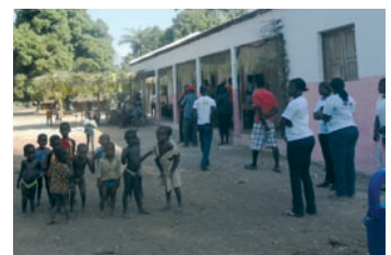
■ Acto de entrega de la escuela a la dirección administrativa